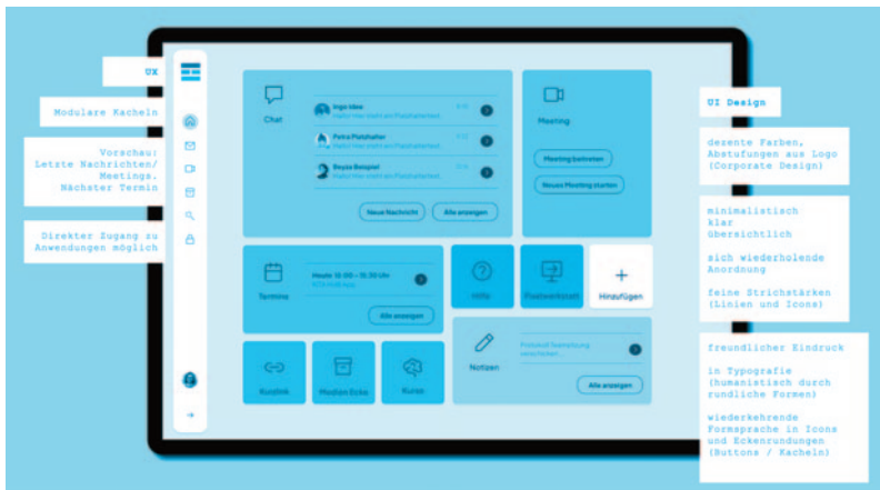
Abb. 1: Designentwurf Dashboard der KITA HUB App

Indem verschiedene Webdienste in einer einzigen Anwendung integriert werden, können Nutzende nahtlos zwischen verschiedenen Funktionen wechseln, ohne den Fokus auf die ausführende Tätigkeit zu verlieren. Dies führt zu einer effizienteren Nutzung und einer insgesamt angenehmeren Erfahrung. Ein nicht zu unterschätzender Erfolgsfaktor auch im staatlichen Umfeld ist die Anbindung von Software und die damit einhergehenden Sicherheits- und Verfahrensprüfungen. Der KITA HUB mit seinen vielfältigen Diensten und Anwendungen stellt die IT vor Herausforderungen, diese verfahrensgerecht einzubinden. Mit der KITA HUB App wird die Einbindung einfach und effizient gehalten. Die Freigabeprozesse und Datenschutzmaßnahmen sind nur für eine Client-Software nötig und können von Systemadministratoren mit überschaubarem Aufwand angewendet werden.